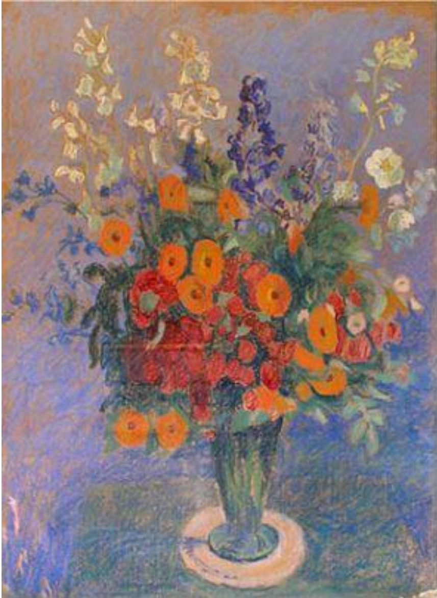
"Blomster i vase" Alhed Larsen