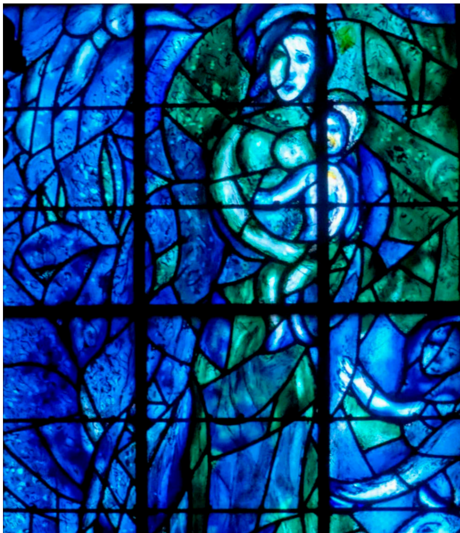
Maria med barnet, Marc Chagall, 1974, Reims