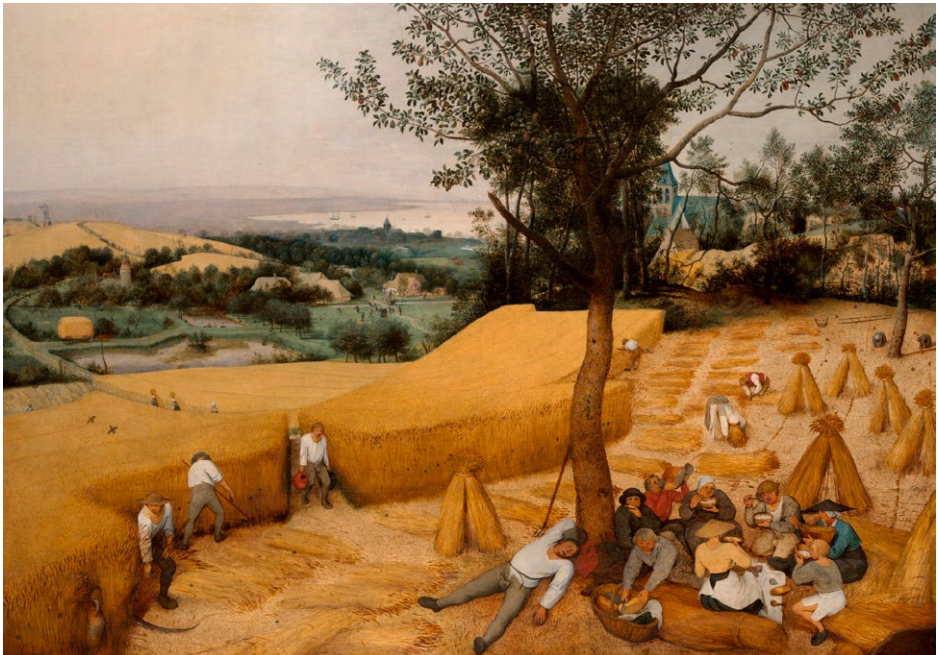
Pieter Bruegel den Ældre, Høst, 1565.